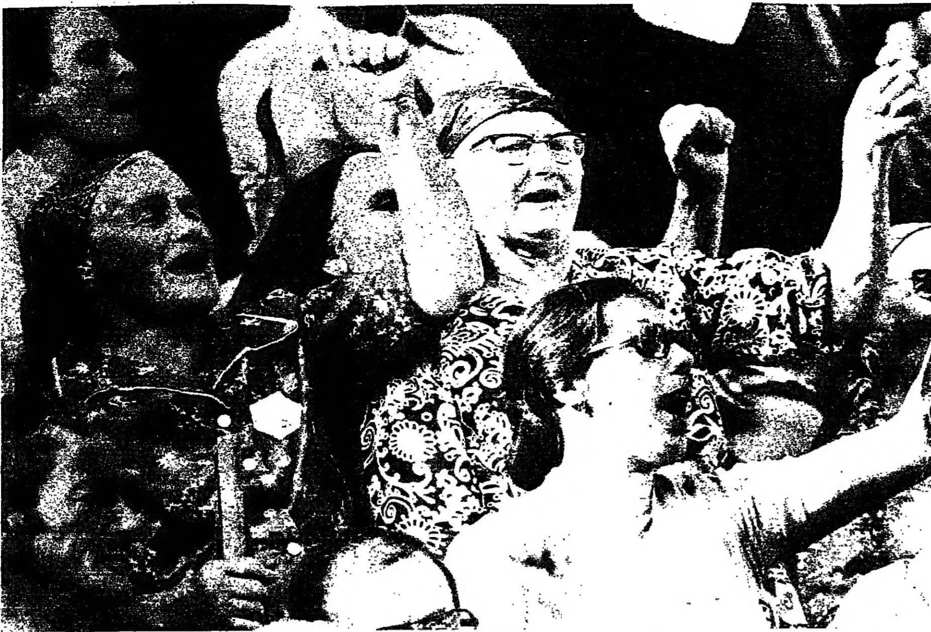
■ عجلة الوحدة ، رسمها نساء برتغاليات ضد القوى المتنازعة